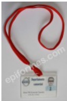
Identificacion Transperante Horizontal Rigida 1.24€ (IVA no incluido)