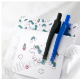
Salvabolsillos en pvc unicornios 4.00€ (IVA no incluido)