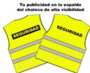
Personalizacion De Chaleco