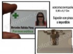
Acreditacion Horizontal 9 X 5,7 Cm 0.50€ (IVA no incluido)