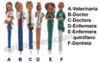
Bolígrafo sanidad en resina 2.69€ (IVA no incluido)