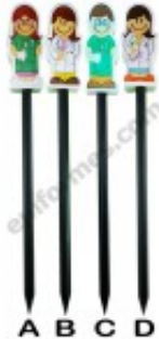
Goma de borrar + Lápiz (PREMIO INFANTIL) 0.99€ (IVA no incluido)