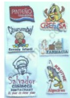
Bordados 5.12€ (IVA no incluido)