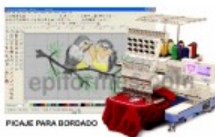
Picaje Para Bordado SOLO SE