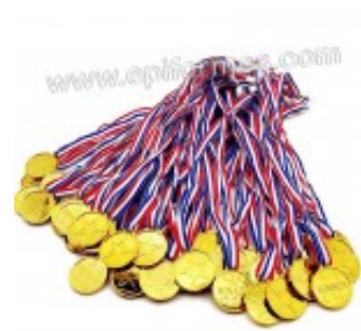
Trofeo de oro (Plástico) Premio infantil 1.23€ (IVA no incluido)