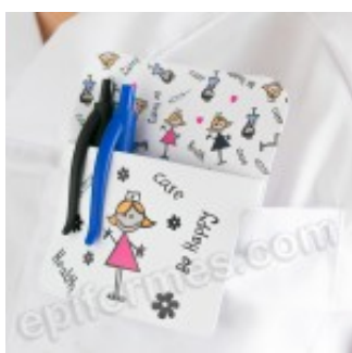
Salvabolsillos en pvc care 4.00€ (IVA no incluido)