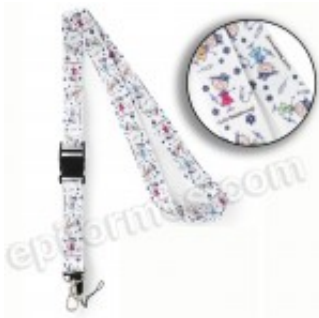
Layards estampados unicornios 5.33€ (IVA no incluido)