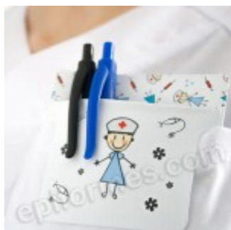
Salvabolsillos en pvc Meniques 4.00€ (IVA no incluido)