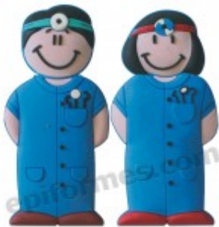
Memoria USB de dentistas 16Gb 10.74€ (IVA no incluido)