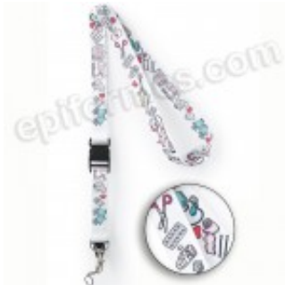
Layards estampados sanitarios, Gute Besserung 5.33€ (IVA no incluido)