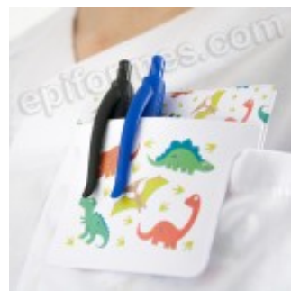
Salvabolsillos en pvc Dinosaurios 4.00€ (IVA no incluido)