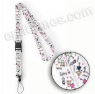
Layards estampados Dinos 5.33€ (IVA no incluido)