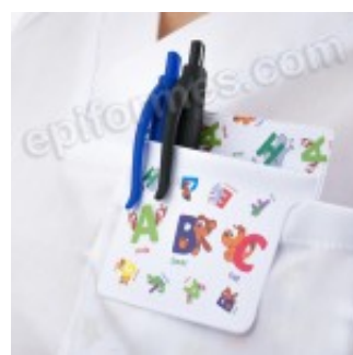
Salvabolsillos en pvc ABC 4.00€ (IVA no incluido)