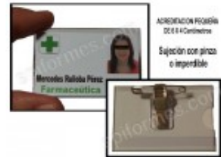
Acreditacion Horizontal 6,4 X 4 Cm 0.40€ (IVA no incluido)