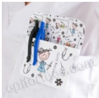
Salvabolsillos en pvc médicos 4.00€ (IVA no incluido)