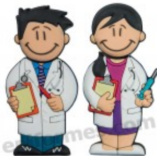
Memoria USB de medicos 16Gb 10.74€ (IVA no incluido)