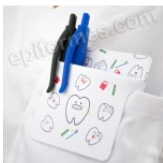
Salvabolsillos en pvc dientes 4.00€ (IVA no incluido)