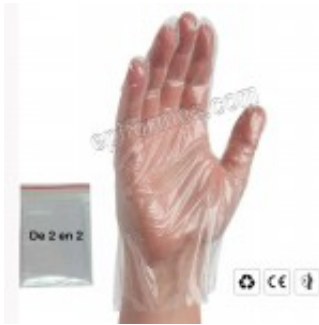
400 guantes polietileno, plegados de 2 en 2 8.00€ (IVA no incluido)