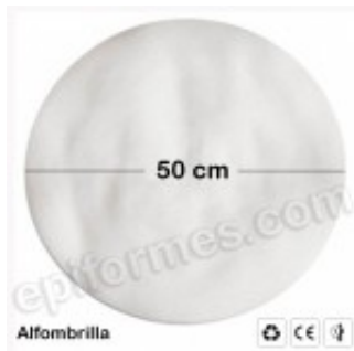
50 Alfombrillas Circulares en TNT desechable. 8.00€ (IVA no incluido)