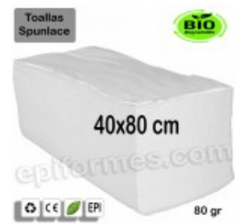
50 Toallas Bio 40x80 cm en blanco 80 gr 16.00€ (IVA no incluido)