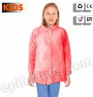
5 Batas desechables de cadete en rojo 6.20€ (IVA no incluido)