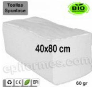
50 Toallas Bio 40x80 cm en blanco 60 gr 12.80€ (IVA no incluido)