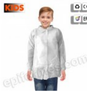
5 Batas desechables infantiles en blanco