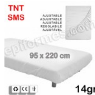
10 Sábana ajustable desechable 95x220 en 14 gr en SMS 10.00€ (IVA no incluido)