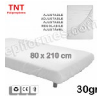
10 Sábana ajustable desechable 80x210 en 30 gr 9.20€ (IVA no incluido)