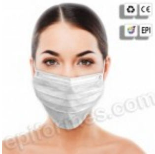
50 mascarillas higiénicas, triple capa en Blanco 3.06€ (IVA no incluido)