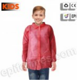
5 Batas desechables infantiles en rojo