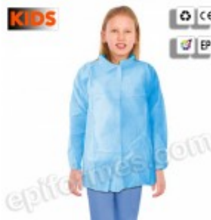
5 Batas desechables de cadete en azul 6.20€ (IVA no incluido)