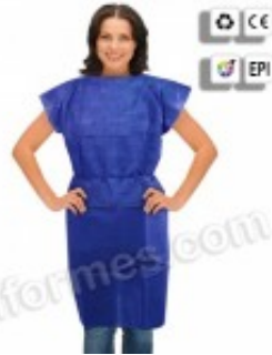
10 Batas en TNT paciente sin mangas 9.59€ (IVA no incluido)