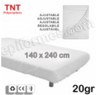
10 Sábana ajustable desechable 140x220 en 20 gr 8.40€ (IVA no incluido)