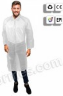
10 Batas de Polietileno con corchetes en blanco 7.02€ (IVA no incluido)