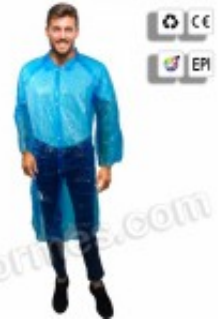
10 Batas de Polietileno con corchetes en azul