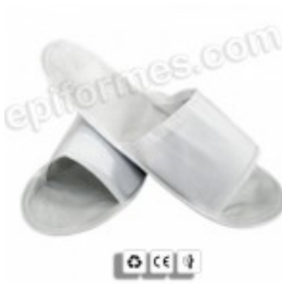
10 Zapatillas abiertas desechables 6.00€ (IVA no incluido)