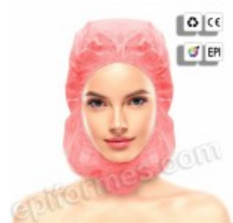
50 Gorros Integrales en Polipropileno rojo 9.50€ (IVA no incluido)