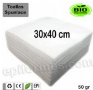
100 Toallas Bio 30x40 cm en blanco 50 gr