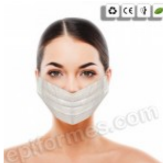
100 mascarillas de papel 2.47€ (IVA no incluido)