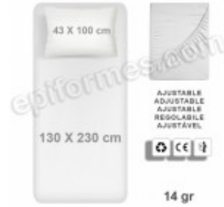
10 Kits de Cama TNT, funda almohada + sabana ajustable 12.90€ (IVA no incluido)