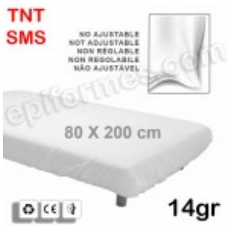
10 Sábana no ajustable desechable 80x200 en 14 gr en SMS 6.10€ (IVA no incluido)