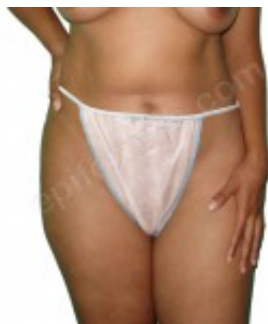
100 Tangas dama desechables