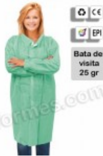
10 Batas de visita en TNT verde 10.25€ (IVA no incluido)