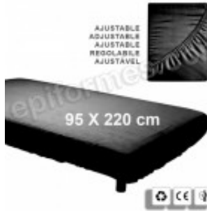
10 Sábanas en TNT de polipropileno negras 10.20€ (IVA no incluido)