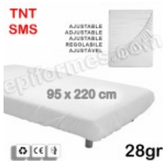
10 Sábana ajustable-Plus desechable 95x220 en 28 gr en SMS 17.60€ (IVA no incluido)