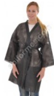
20 Kimonos desechables en polipropileno 19.00€ (IVA no incluido)