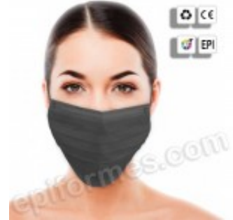
50 mascarillas higiénicas, triple capa en negro 3.06€ (IVA no incluido)