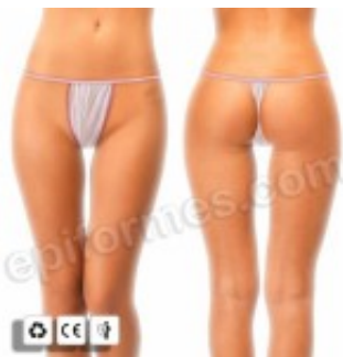
100 Tangas mini desechables en TNT