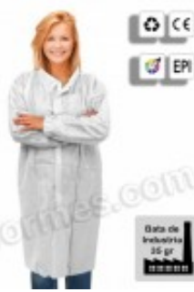
10 Batas de industria en TNT blanco 15.20€ (IVA no incluido)