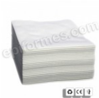
50 Toalla de "Air-Laid" 40x80 cm 12.10€ (IVA no incluido)