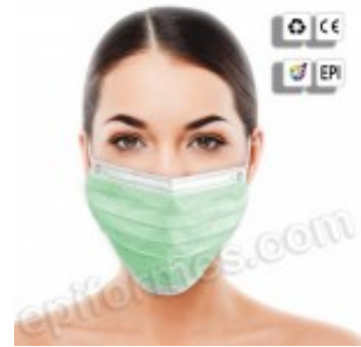
50 mascarillas higiénicas, triple capa en verde 3.06€ (IVA no incluido)