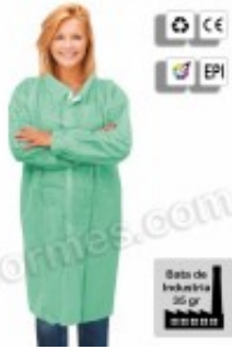
10 Batas de industria en TNT verde 15.20€ (IVA no incluido)