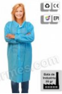
10 Batas de industria en TNT azul 15.20€ (IVA no incluido)