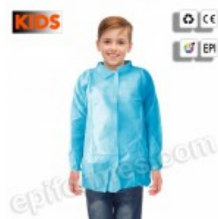
5 Batas desechables infantiles en azul 6.20€ (IVA no incluido)