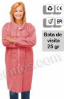
10 Batas de visita en TNT rojo 10.25€ (IVA no incluido)