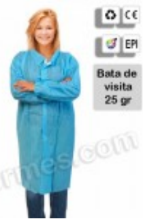
10 Batas de visita en TNT azul 10.25€ (IVA no incluido)