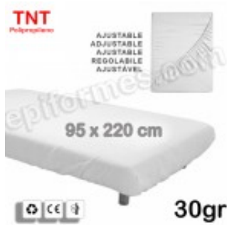
10 Sábana ajustable desechable 95x220 en 30 gr 10.20€ (IVA no incluido)