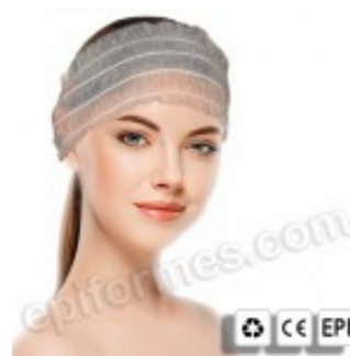
Bolsa de 100 diademas (Cintas de pelo) desechables