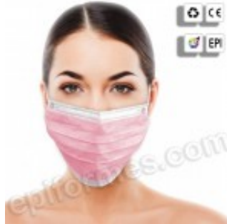
50 mascarillas higiénicas, triple capa en rosa 3.06€ (IVA no incluido)