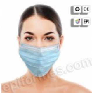
50 mascarillas higiénicas, triple capa en azul 3.06€ (IVA no incluido)