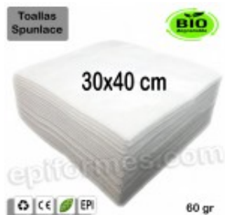
100 Toallas Bio 30x40 cm en blanco 60 gr