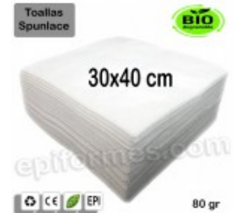
100 Toallas Bio 30x40 cm en blanco 80 gr 13.40€ (IVA no incluido)