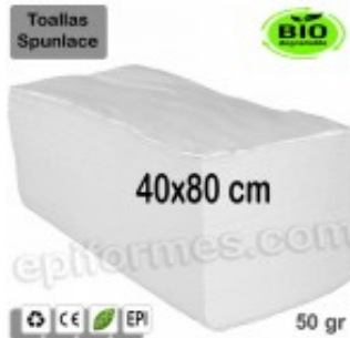
50 Toallas Bio 40x80 cm en blanco 50 gr 10.30€ (IVA no incluido)